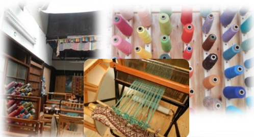
つきあたりは「さをり織り」の工房 世界に一つ、あなただけの作品を 自分のペースで作ってみませんか？