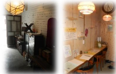
入口から2つの土間スペースは 500円/月でレンタルできます