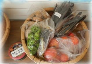
入り口には地域の旬な野菜販売があり