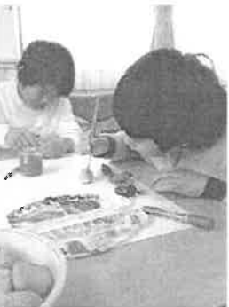
さっそく小石に色つけ