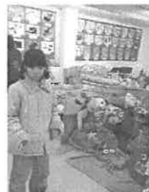
作品展の見学2月18日 スポーツ文化センターにて