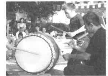
どん舞の太鼓演技 親子競演

「今年のテーマは体験」 毎年11月第一日曜日はまごころふれあいまつり。今年とは逆に快晴のまつり日和になりました。高齢者体験、アートバルーン作り体験、仮装体験、楽器演奏体験、和太鼓体験などなど盛沢山なコーナーで地域の人々とのふれあいが出来ました。バザーでは10時のスタートを待ちきれない方々でいっぱいでした。今年も手作りの作品などたくさんの提供品を頂きまして有難うございました。