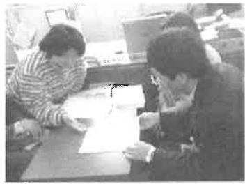
お願い文書を提出する 実行委員

家族に代わって児童デイサービスの事業所の車が学校へ迎えに行き、「学校から施設」への移動の支援を、一宮市独自のサービスとして認めていただくようお願いします。 上映実行委員会