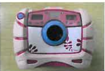
子ども用デジタルカメラ

まだまだいろいろな可能性を感じるので、今後どのような使い方ができるのか楽しみです。