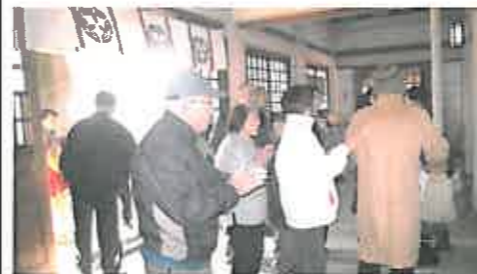
今年も初詣に行きました

お昼の団欒の時。利用者さんとボランティアさん、スタッフとみんなでお食事を頂きます。周りの方と、ご家族のお話や若い時の武勇伝(?)など色々なお話を伺いながら、談笑。「今日のお食事は、いかがですか?」「なにか召し上がりたいものありますか?」と伺ったりするなか、「五目ご飯が食べたいなあ」というリクエストがあればできる限りお応えしながら、担当スタッフが家庭と同じように腕によりをかけて作らせて頂いています。