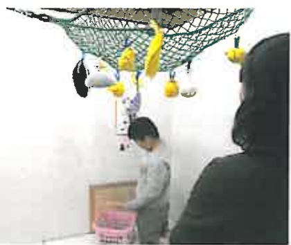
「1人でできるもんね～」 スタッフは見るだけ...

児童デイではほぼ毎月、「〇〇狩りゲーム」と称して(〇〇は果物や、野菜や、魚だったりします)、子どもが部屋に1人入って、指定した物を取ってくるという内容の活動をしています。うまく本人に合わせた支援ができていると、完璧に1人で目標を達成することができ、子どもも、スタッフもニコニコです。