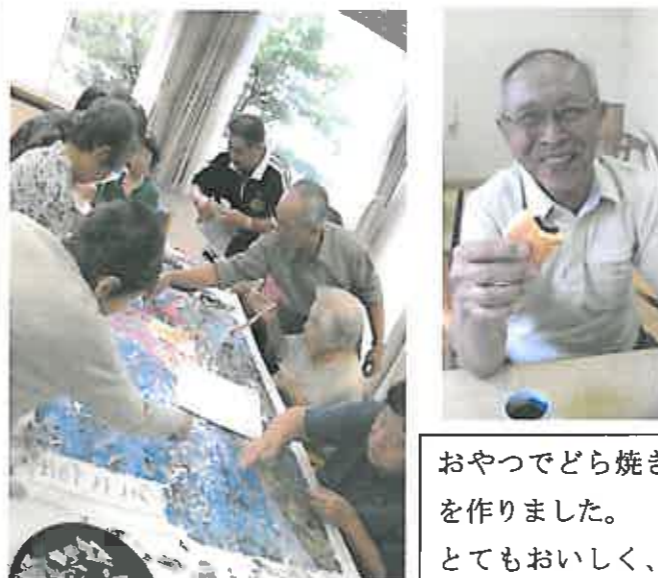
おやつでどら焼きを作りました。とてもおいしく、大好評でした！！