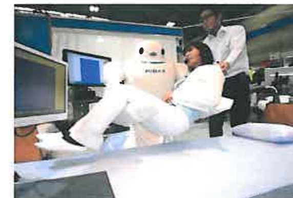
介護ロボットの实演