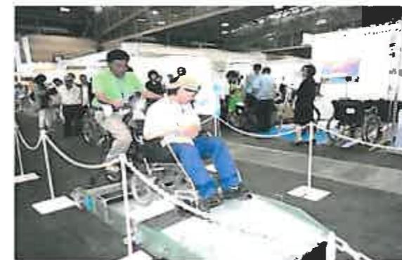
車椅子付き自転車が段差乗り越え

確かに便利になっておりますが、どうしても値段が高いのでしょうか、もっと誰もが身近に使える手軽に普及できるようになって欲しいと思います。