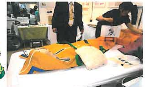
介護機能付き防災マット(マットごと移動可)