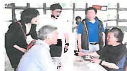
食事についてお聞きしました

自立した高齢者が300人ほど入所されており、1,000人が待機されているそうです。自分の部屋から食堂に移動して食事を並んで受け取られていた。部屋には電化製品も完備している。