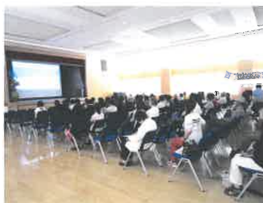
会場の様子(左)、舞台上のモザイク画(右)