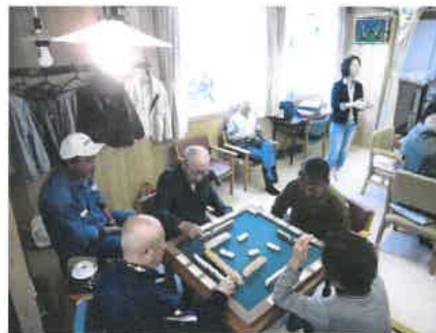
木曜日のサロン風景

火曜日のサロンが9:30～16:00の時間帯で 開催して早、1ヶ月になりました。お陰さまで少し ずつ利用が増えております。