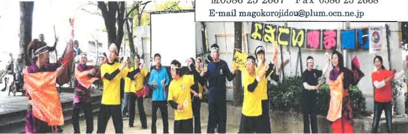
天・尾張組&まんまるさんの踊り