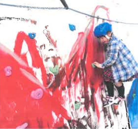
ボルダリングを楽しむ子ども達 東京オリンピックを目指して欲しいです

特定非営利活動法人一宮まごころ 〒491-0041 一宮市文京1丁目4-6 TEL0586-73-8707 Fax 0586-73-8870 E-mail magokoro@plum.ocn.ne.jp ホームページ http://www.npo-magokoro.jp 放課後デイサービスまごころレフト・ライト 〒491-0023 一宮市赤見4丁目2-4 TEL0586-25-2667 Fax 0586-25-2668 E-mail magokorojidou@plum.ocn.ne.jp