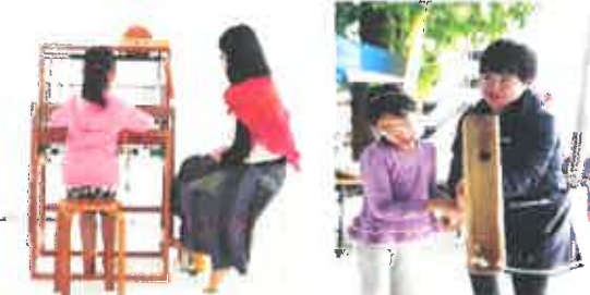
さをり織の少女と餅つく少女