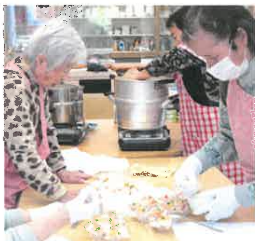
卵パックを使ったシュウマイ作りにも挑戦