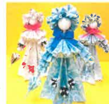
チラシで作った人形

ヘルパーさんが本当に良くしてくれるので、とても助かっています。みなさんのお蔭で一人暮らしができていますので、感謝しています。