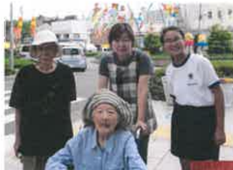
一宮七夕まつり見学