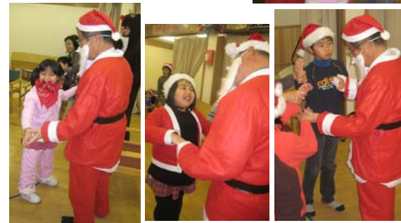
サンタさんの登場にビックリ！交流を楽しみました。