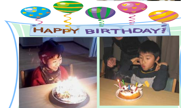
誕生日おめでとう！！