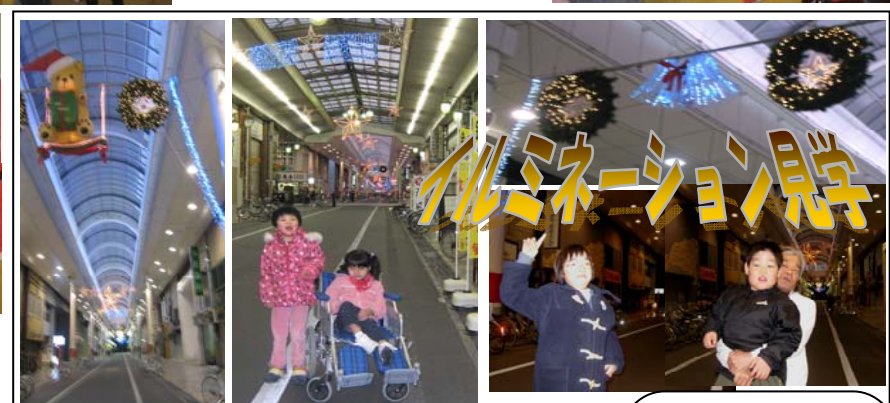
本町商店街へ、イルミネーションを見に行きました。