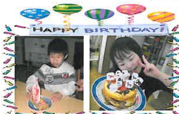
誕生日おめでとう!!