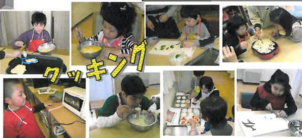
ミニピザ、たこ焼きの他、初の揚げ物、「さつまいもスティック」にも挑戦しました。

4月になり、新規に利用される子どもたちが入って、昨年度とはまた違った雰囲気です。新しいスタートをきりました。 「まごころに慣れてくれるだろうか...?」という職員への心配をよそに、本当に初めての利用なのかと思えるぐらい、自然にまごころの活動に溶け込んでいました。