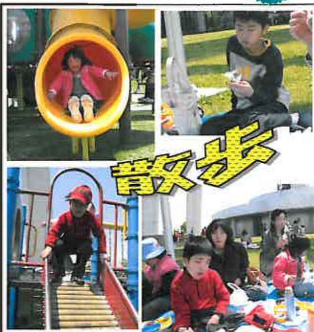
人数の少ない日には、タワーパークや野黒公園に出かけました。

4月になり、新規に利用される子どもたちが入って、昨年度とはまた違った雰囲気です。新しいスタートをきりました。 「まごころに慣れてくれるだろうか...?」という職員への心配をよそに、本当に初めての利用なのかと思えるぐらい、自然にまごころの活動に溶け込んでいました。