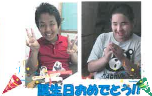
誕生日おめでとう!