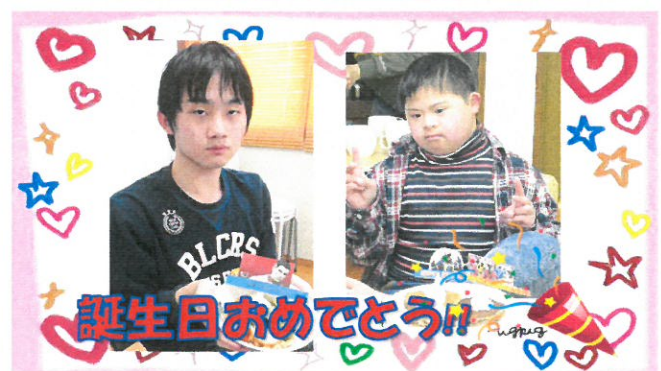
誕生日おめでとう!!