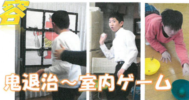
鬼退治～室内ゲーム